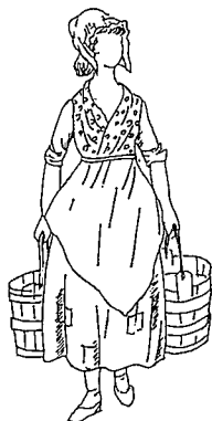
図3 搾乳婦 (1777年)

農村女性の服装の特色としては、ヨーロッパの庶民服と同様にエプロンと布製の被りものの着用が指摘され、また服装の形態は簡素で実用本位ではあるが、ヨーロッパの都市の庶民服にかなり近いことが注目される。それは被りものの形態においてとくに顕著である。また、作業着としての特別な衣服形態はなかったとみられる。