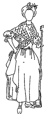
図5 植民地時代のアメリカのハウスメイド (1775年)

以上を総合すると、アメリカでもヨーロッパと同様に庶民服の特色として、エプロンと布製の被りものが伝承されており、服装の形態としては、農村の服装はヨーロッパの都市の服装に近く、都市では細胴の強調と袖の形態にフランス服飾の影響が強くあらわれている。また、都市、農村ともに作業着としての機能性を考慮した特別な衣服の形態はみられず、丈の長いローブまたはスカートがあらゆる生活の場に着用された基本的な衣服形態であった。