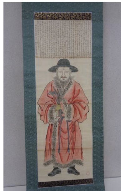
図版① 千秋文庫所蔵『米光之図』全体